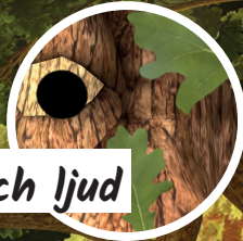
Musik och ljud