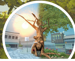
Årstider och väder